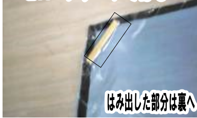
⑤切った約3cmの竹ひごをセロハンテープではる