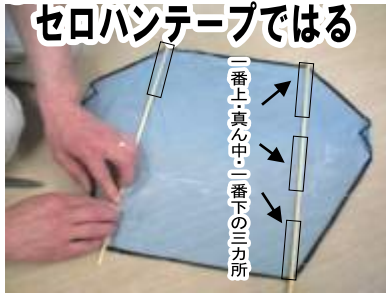
⑧同じ長さを2本切ったらセロハンテープではる