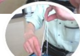
たぐれば真ん中がわかる