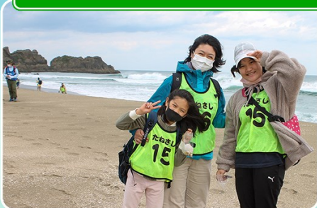
春を感じて(みちのく潮風トレイル)