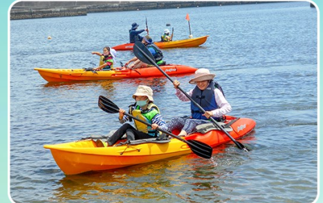
エンジョイ!海遊び(カヌーあそび)