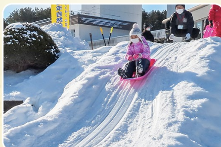
エンジョイ!雪遊び(そりあそび)