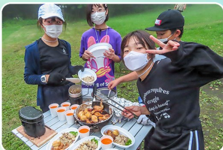
サマーキャンプ(野外炊事)