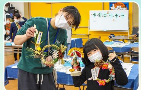
冬の季節を感じて(門松・しめかざり作り)