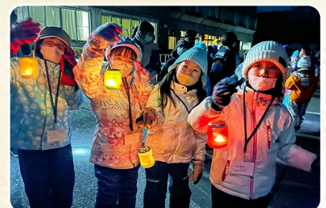
こども大作戦(ランタンハイク)