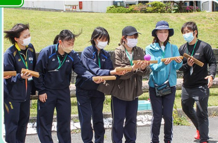
自然体験活動研修会(アドベンチャーゲーム)