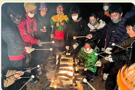
ウインターキャンプ(キャンプファイヤー)