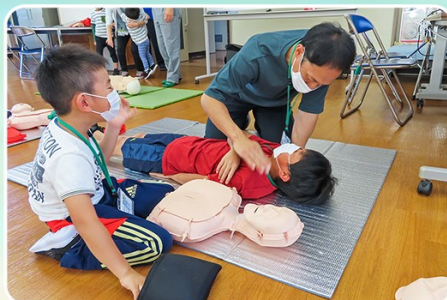
親子の絆 防災キャンプ(救急救命)