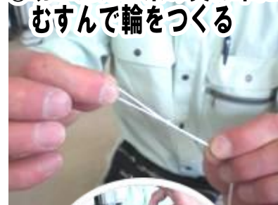
⑫切ったたこ糸の真ん中にむすんで輪をつくる