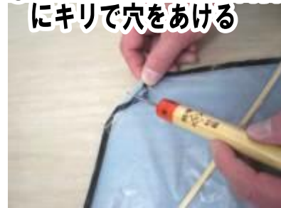
⑨約3cmの竹ひごの内側にキリで穴をあける