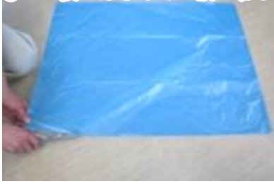
①ゴミ袋をはさみで二枚に切る