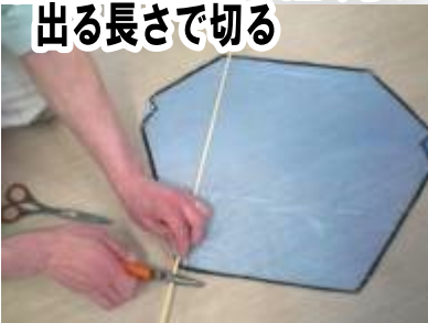
⑦竹ひごを上下1cmぐらい出る長さで切る