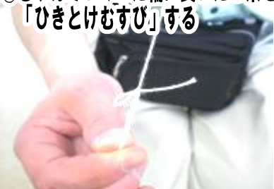
⑬むすんでつくった輪に長いたこ糸を「ひきとけむすび」する