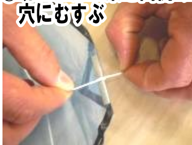
⑪切ったたこ糸を両側の穴にむすぶ