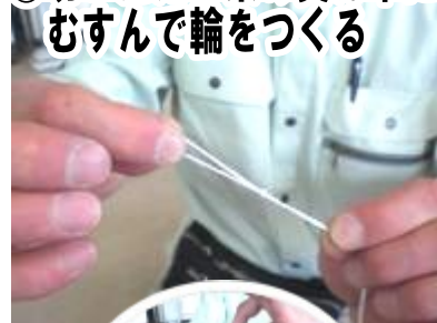
⑫切ったたこ糸の真ん中にむすんで輪をつくる