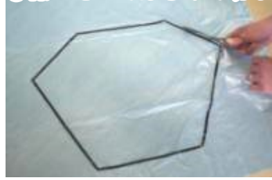
③線にそってのはさみで切る