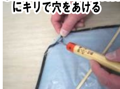
⑨約3cmの竹ひごの内側にキリで穴をあける