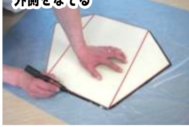
②1枚のゴミ袋の上に型紙をおき外側をなぞる