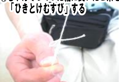
⑬むすんでつくった輪に長いたこ糸を「ひきとけむすび」する