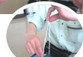
たぐれば真ん中がわかる