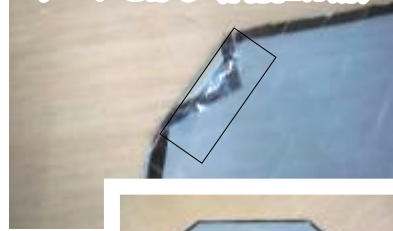
⑥折り曲げて、さらにセロハンテープをはる(両側2カ所)