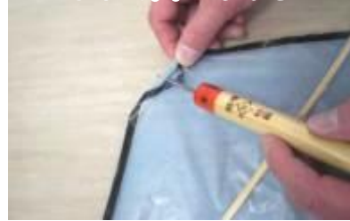
⑨ 約3 cmの竹ひごの内側にキリで穴をあける