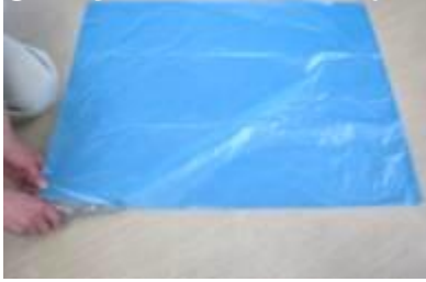
① ゴミ袋をはさみで二枚に切る