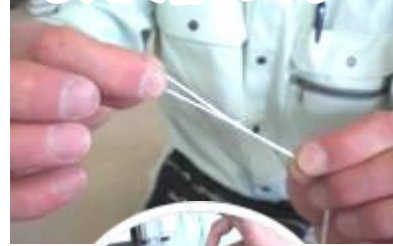
⑫ 切ったたこ糸の真ん中にむすんで輪をつくる