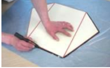
② 1枚のゴミ袋の上に型紙をおき外側をなぞる