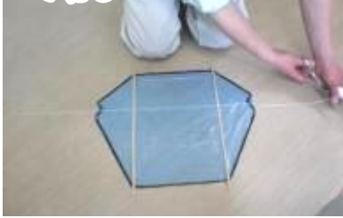
⑩ たこ糸を約1.4mの長さで切る