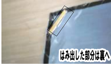
⑤ 切った約3 cmの竹ひごをセロハンテープではる