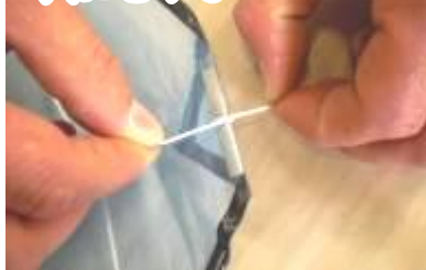
⑪ 切ったたこ糸を両側の穴にむすぶ