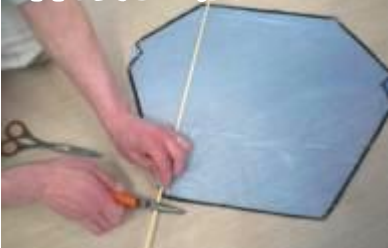
⑦ 竹ひごを上下1 cmぐらい出る長さで切る