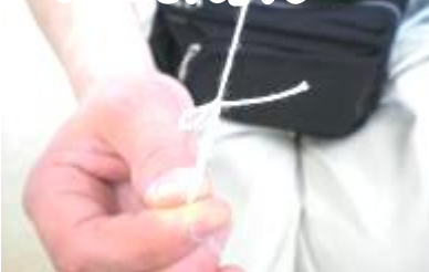
⑬ むすんでつくった輪に長いたこ糸を「ひきとけむすび」する