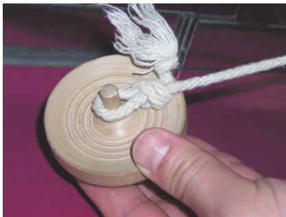
ひもの先を輪にする