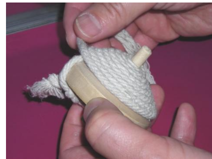
巻きつけたところ