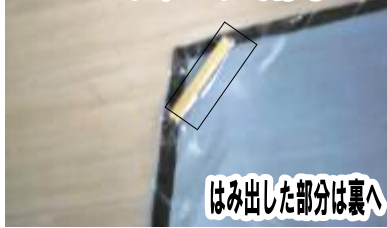
⑤ 切った約3 cmの竹ひごをセロハンテープではる