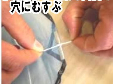
⑪ 切ったたこ糸を両側の穴にむすぶ