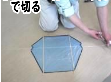
⑩ たこ糸を約1 mの長さで切る