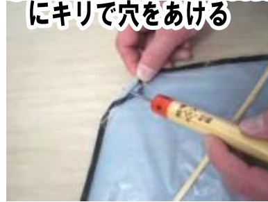
⑨ 約3 cmの竹ひごの内側にキリで穴をあける