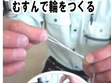
⑫ 切ったたこ糸の真ん中にむすんで輪をつくる