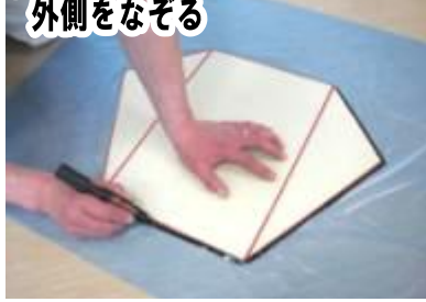
② 1枚のゴミ袋の上に型紙をおき外側をなぞる