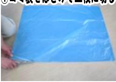
① ゴミ袋をはさみで二枚に切る