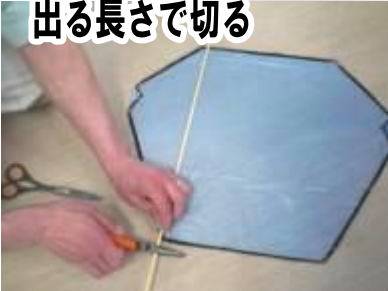
⑦ 竹ひごを上下1 cmぐらい出る長さで切る