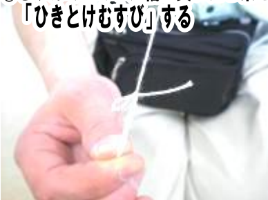
⑬ むすんでつくった輪に長いたこ糸を「ひきとけむすび」する