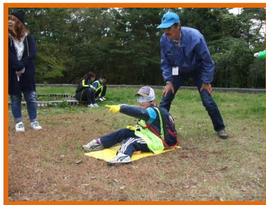
【いねむりおじさん】