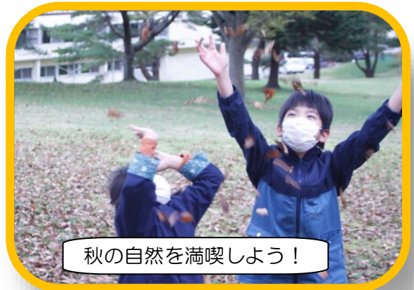
秋の自然を満喫しよう！